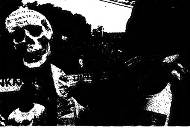
مئات المتظاهرين يفتحون النار لتفريق متظاهرين في وسط جاكرتا

● جاكرتا (الاندونيسيا) - لندن - قالت صحيفة واشنطن بوست إن الجيش الاندونيسي يفتح النار لتفريق متظاهرين في وسط جاكرتا. وقال مدير واشنطن بوست إن الجيش الاندونيسي يفتح النار لتفريق متظاهرين في وسط جاكرتا. وقال مدير واشنطن بوست إن الجيش الاندونيسي يفتح النار لتفريق متظاهرين في وسط جاكرتا.